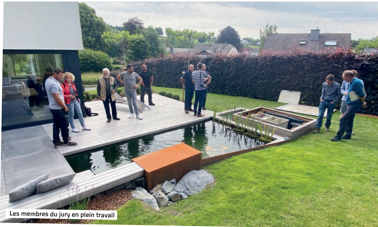
Les membres du jury en plein travail