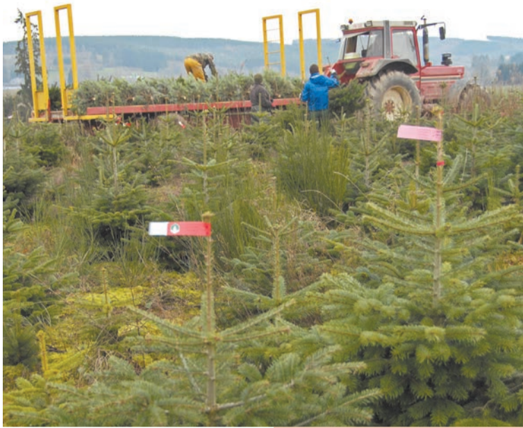
Cultiver les sapins de Noël est aujourd'hui devenu un métier

Dans le courant du XIX e siècle (19 e siècle, les années 1800), ces terres de culture et d'élevage ont été abandonnées suite à l'exode rural. Les Provinces et l'Etat, soucieux de reboiser les terres en friche de la province du Luxembourg et du sud de la province de Namur, favorisèrent la reconversion des terres abandonnées en plantations de forêts d'épicéas communs. Ceux qui pratiquèrent les reboisements et en tiraient profit par la vente du bois créèrent les premières pépinières forestières.