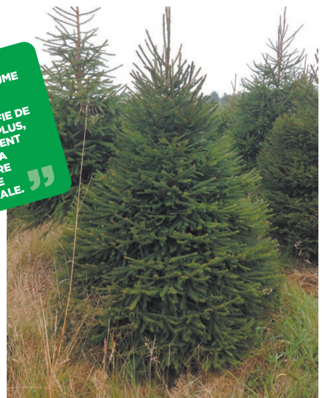
Le pépiniériste veille durant de nombreuses années sur la croissance de l'arbre de Noël pour lui donner une qualité et une forme idéales.

LA COUTUME DU SAPIN DE NOËL S'INTENSIFIE DE PLUS EN PLUS, NOTAMMENT APRÈS LA PREMIÈRE GUERRE MONDIALE.