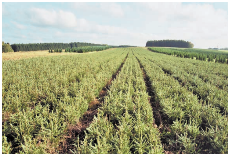
Pépinière de sapins en Ardenne